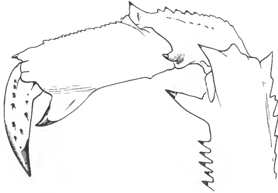
FIG. 7. — Palinurus charlestoni sp. nov., ♂ 200 mm : premier péréiopode gauche, face externe (d'après une photographie communiquée par P. DA FRANCA) ( \times 0,5 ).

L'épine distale cornée présente sur le bord supérieur du mérus des pattes suivantes ne correspond pas, par son développement relatif, à la spinulation d'ensemble de la carapace et de la première paire de péréiopodes.